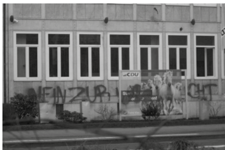
Die angegriffene CDU-Fassade

Zuerst sollte das Ziel der Aktion wohl im Losverfahren entschieden werden. Am Ende reichten Kapas (und Buttersäure) offenbar für einen Besuch beider Geschäftsstellen. Die CDU-Landesgeschäftsstelle trägt noch die Spuren der verschiedenen Angriffe der letzten Monate. Zum Glück der Aktivist*innen, war auf der Fassade scheinbar noch genug Platz für den neuen Schriftzug. An anderen Stellen überlagern sich bereits die Farben der Farbbomben vergangener Besuche. Praktisch also, dass mit diesem Angriff nun auch andere Sinne angesprochen werden. Im Gegensatz dazu war die Geschäftsstelle der SPD offenbar bisher unbeschädigt – und das obwohl sie auch als Wahlkreisbüro von Boris Pistorius dient. Ein Kriegsminister, der eine Waffenmesse in Hannover mit solchen Wor-