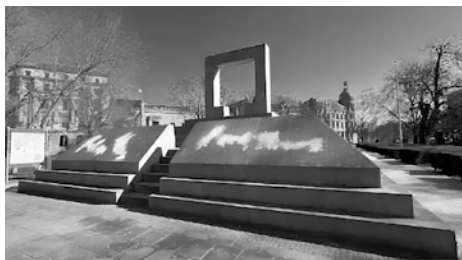
Holocaust-Mahnmal mit bereits übermalten Parolen.

In der Nacht auf den 18. März wurde das Holocaust-Mahnmal am Opernplatz Hannover, das an die Opfer der Shoah erinnert, mit antisemitischen Parolen verschandelt. Da die Cops das Geschmiere zeitnah unkenntlich gemacht haben, bleibt offen, welcher Gesinnungsrichtung die Antisemit*innen zuzurechnen sind, die ihren Hass hier zum Besten gegeben haben. ■